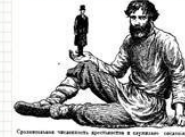
Средствоземельное хозяйство, возделывание и обработка почвы.

Цель урока: выяснить пути решения крестьянского вопроса в России, предложенные П.А. Столыпиным