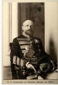
П. А. Столыпин из Лангеман. Липецк, ок. 1908 г.